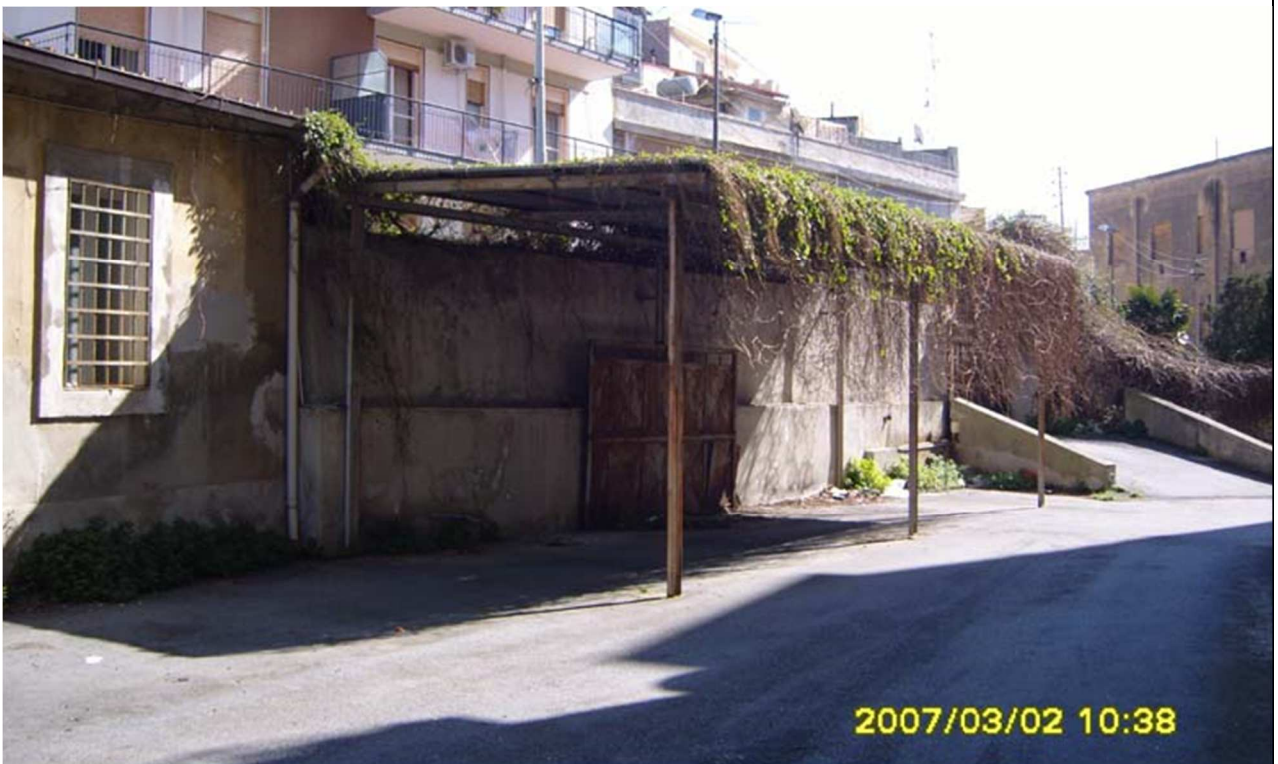
Fig. 4: Vista Interna all'area - Foto datata