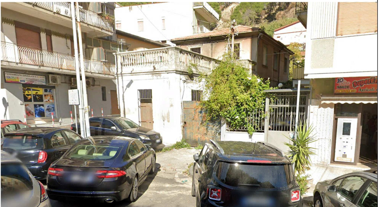
Fig. 2: Vista ingresso da Via Pietro Castelli