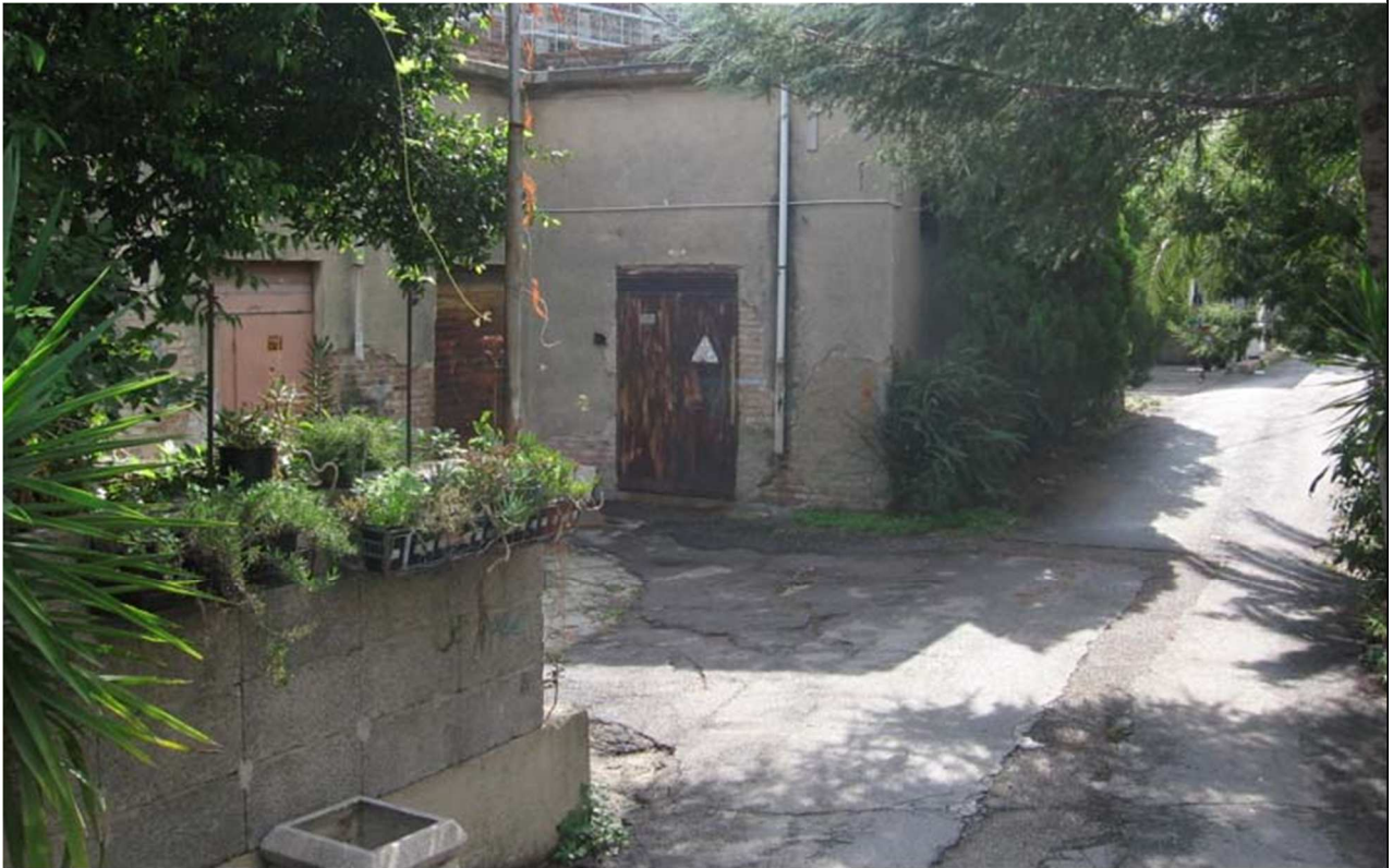
Fig. 3: Vista Interna all'area - Foto datata