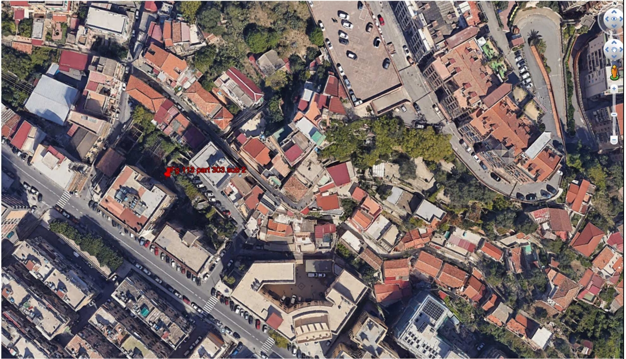
Fig. 1: Vista Satellitare