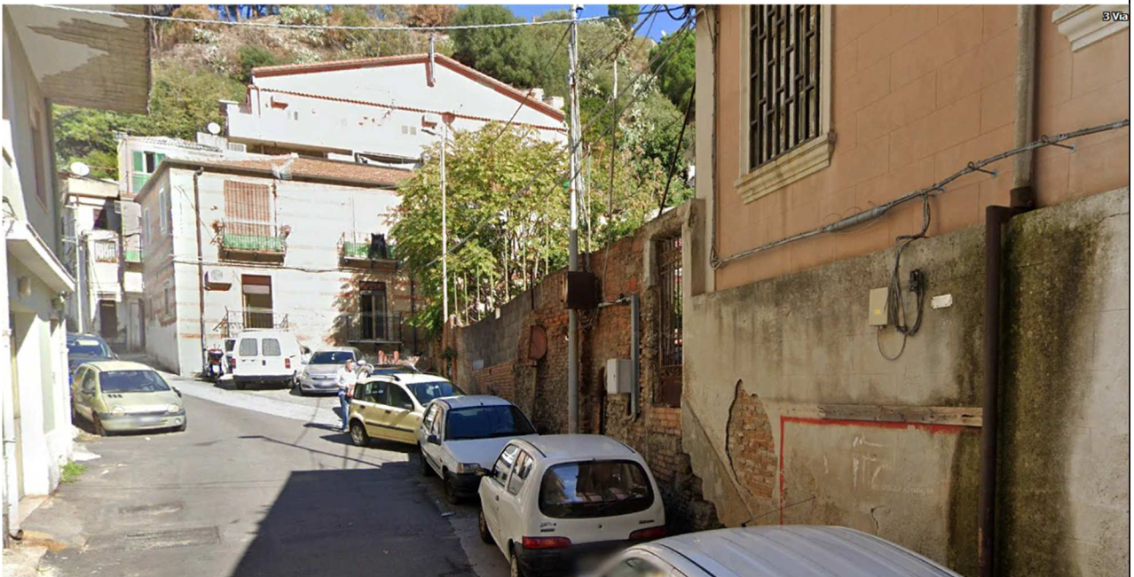
Fig 3: Vista laterale da Via Alberto Corrao