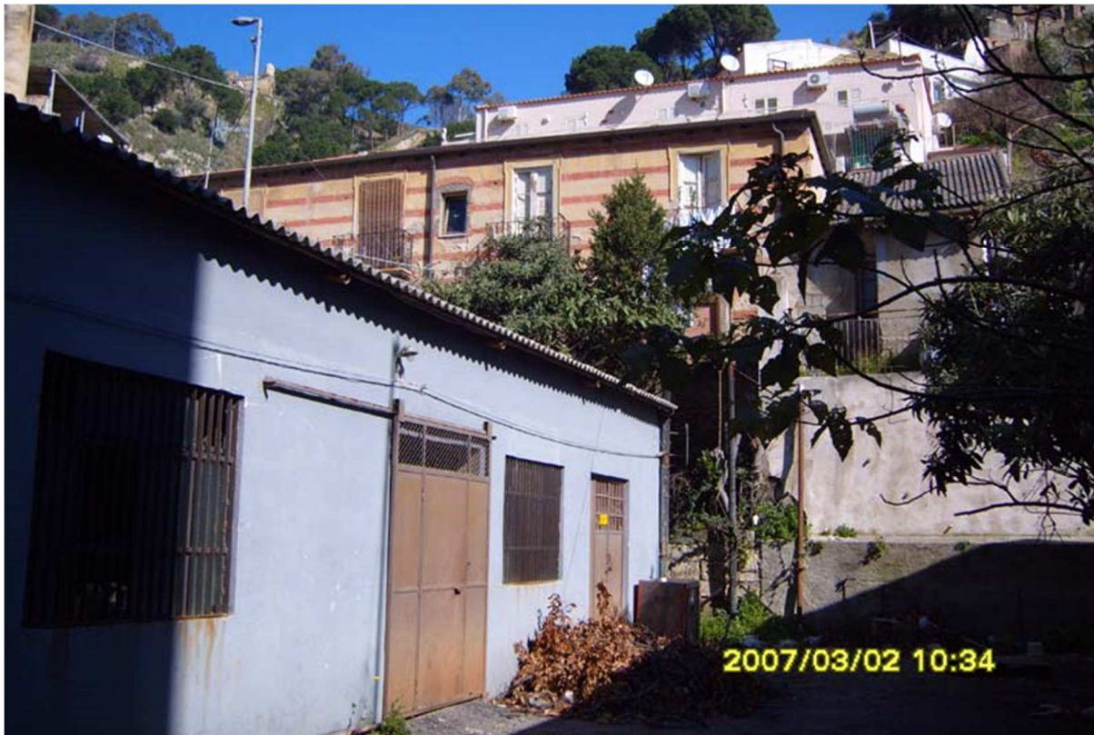
Fig 3: Vista datata dall'ingresso dell'area ex Amam